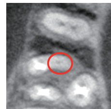
以前の治療で見逃されていた部分

通常のレントゲンでは平面としてしか捉えることができないため、正確な根の構造を知ることは極めて困難です。当院が導入している歯科用CTでは、歯の内部を立体的に撮影可能であり、根の構造を正確に把握することができるため、根の治療の高い成功率に大きく貢献しています。